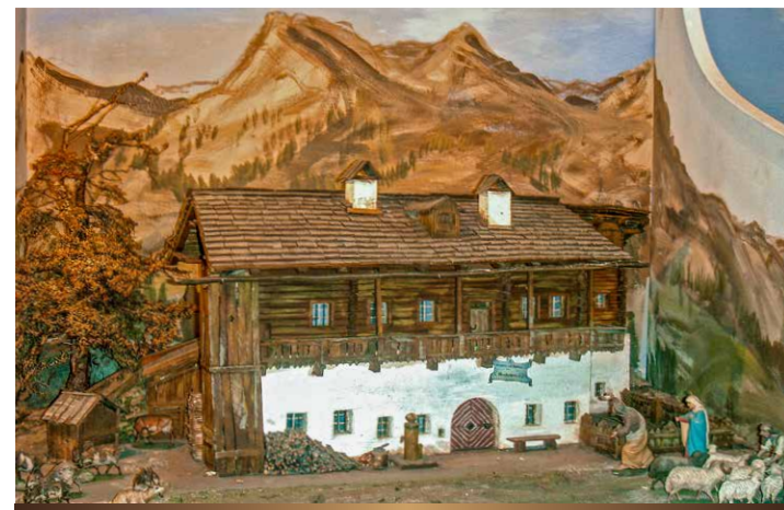
Wirtshaus »Mondschein« um 1600 - Albergo »Mondschein« intorno al 1600