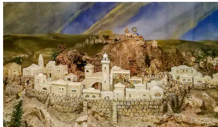
FASTENKRIPPE - PRESEPIO DELLA PASSIONE DI GESÙ