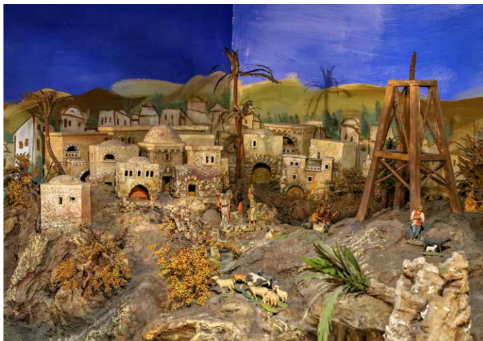
WEIHNACHTSKRIPPE - PRESEPIO NATALIZIO