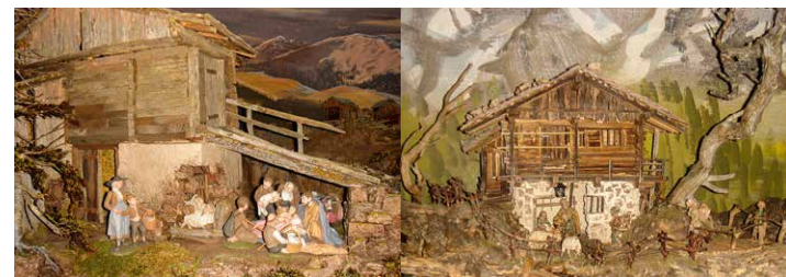
TIROLER KRIPPEN - PRESEPI TIROLESÌ